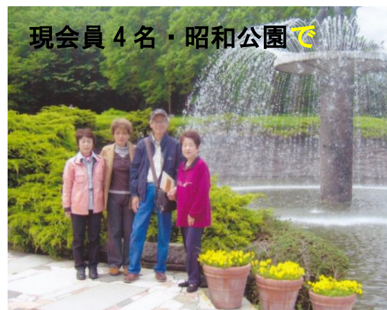
現会員4名・昭和公園で