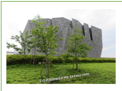
角川武蔵野ミュージアム

「ところざわさくらタウン」は株式会社 KADOKAWA が建設・運営する施設で、図書館・美術館・博物館が融合した文化複合施設です。その中心となる建物「角川武蔵野ミュージアム」のデザインは隈研吾氏の設計で、ところざわさくらタウンのランドマークとなっています。内部は 8 メートルの巨大本棚に囲まれた本棚劇場等があります。